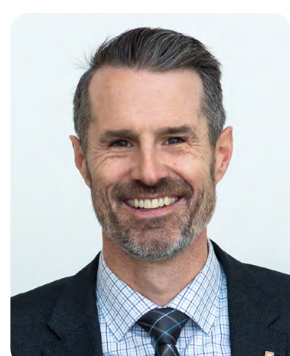
네일 파시나 이사장 아태바스카대학교, 세계원격교육협의회