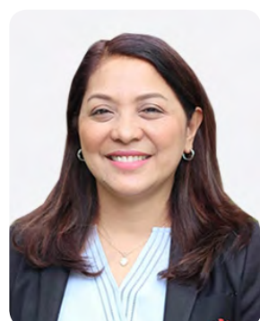
에델 발렌젤라 사무국장 동남아시아 교육부장관기구