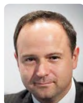
디에고 우르디놀라 선임이코노미스트 월드뱅크