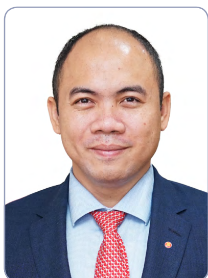
기조연설2 쿵폭 아세안 사무부총장