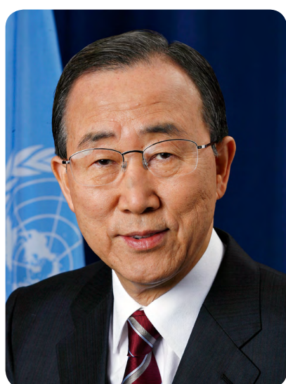
기조연설1 반기문 전 UN사무총장